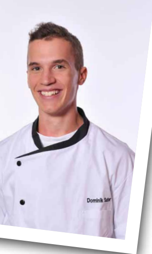
Dominik Suter Restaurant Kaiserstock, Riemenstalden